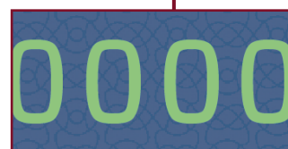
Numeracja typograficzna (świecąca na zielono)